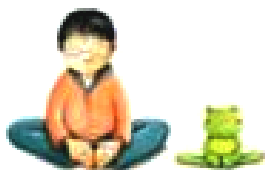
La posture du Papillon