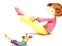
La posture du Bateau