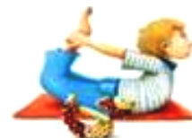
La posture de l'Arc