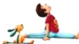
La posture du Singe