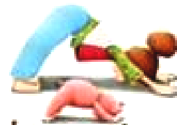
La posture du Chien