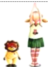
La posture de la Montagne