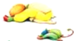
La posture de la Tortue