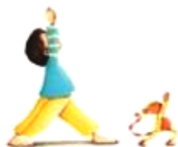
La posture du Guerrier