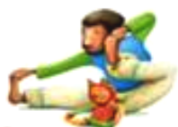
La posture de l'Archer